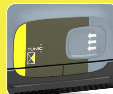
2 stickers de bas de porte