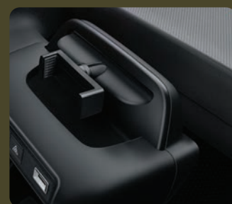
1 pince support pour smartphone