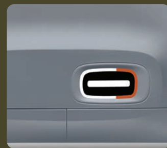
2 stickers de bas de porte