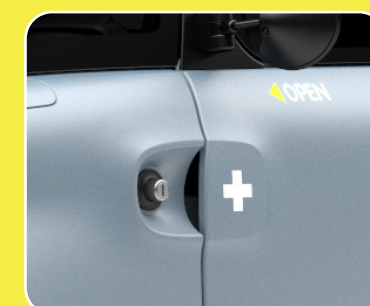
2 stickers entrée de porte «+» «-» et «Open»