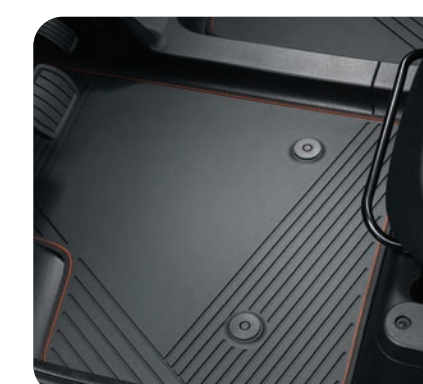
2 tapis de sol noirs à liseret