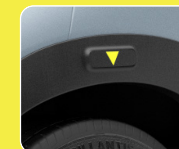
2 sets de passages de roues noirs avec sticker jaune