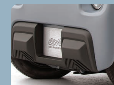
Renfort de pare-chocs avant noir