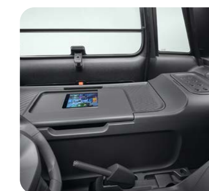
Bureau mobile avec empreinte de format A4 pour déposer des documents ou une tablette

Remplacement du siège passager par une boîte modulaire et protégée. La paroi de séparation verticale vient délimiter la zone conducteur de la zone de chargement.