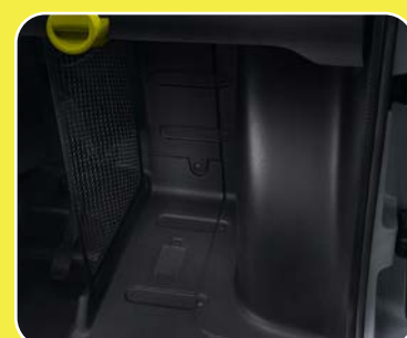
1 filet noir central de séparation