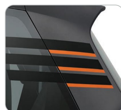
2 stickers de vitres