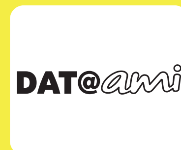
1 boîtier DAT@AMI pour connecter votre smartphone à AMI