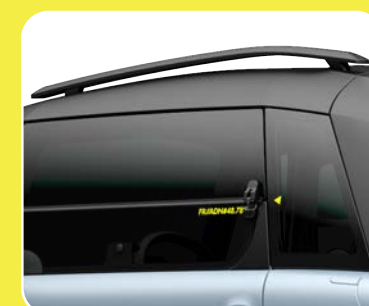
2 barres de toit noires