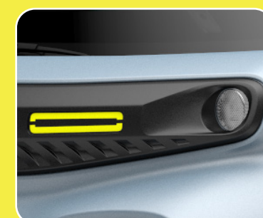
1 masque en haut du pare-chocs avant noir avec sticker jaune