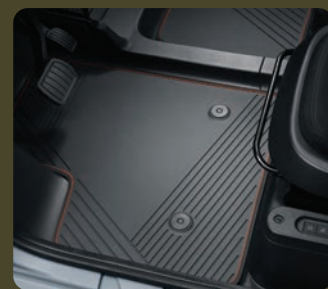
2 tapis de sol noirs à liseret