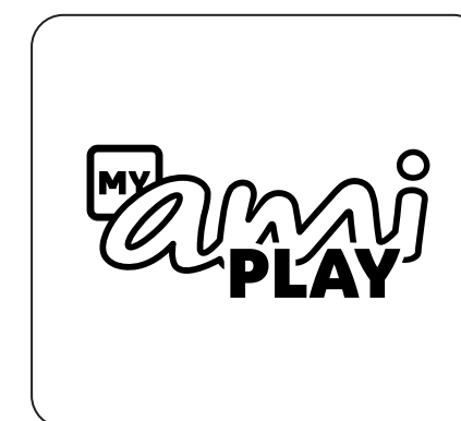
Application My Ami Play et bouton Citroën Switch