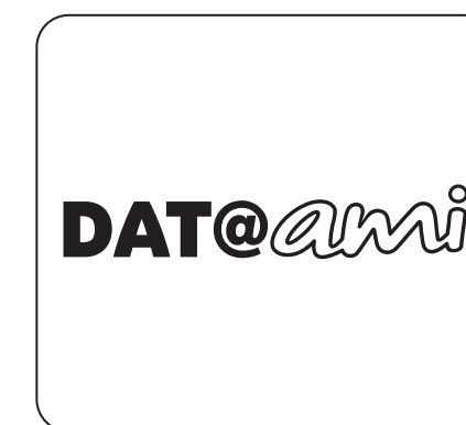
1 boîtier DAT@AMI pour connecter votre smartphone à AMI