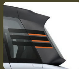
2 stickers de vitres