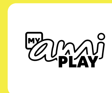
Application My Ami Play et bouton Citroën Switch