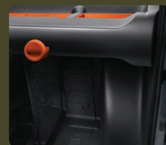
1 filet noir central de séparation