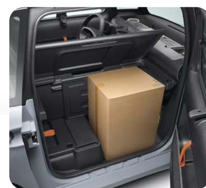
Plancher plat ajustable sur 2 positions