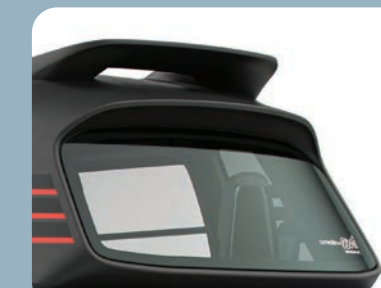
1 aileron noir sur l'arrière du toit