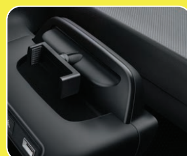
1 pince support pour smartphone