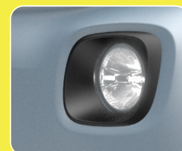
2 enjoliveurs de feux avant noirs