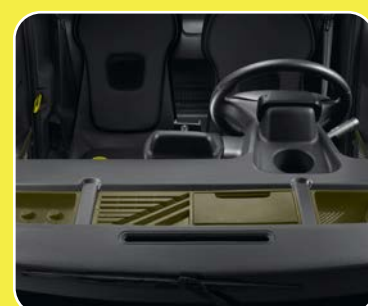
3 bacs de rangement de planche de bord