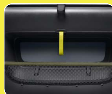
2 filets de porte noirs à bande horizontale