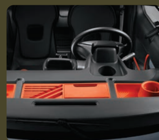
3 bacs de rangement de planche de bord