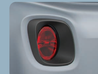
2 enjoliveurs de feux arrière noirs