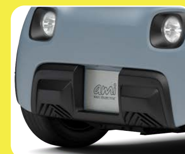
Renfort de pare-chocs avant noir