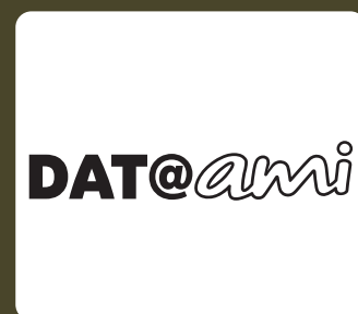
1 boîtier DAT@AMI pour connecter votre smartphone à AMI