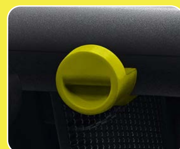
1 crochet à sac côté passager