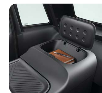
Rangement fermé indépendant pour y abriter des objets comme un smartphone