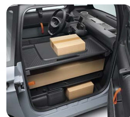
Tablette pouvant supporter un poids de 40kg