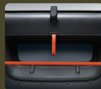
2 filets de porte noirs à bande horizontale