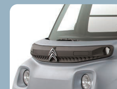
1 masque en haut du pare-chocs avant noir