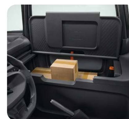
Tablette faisant aussi office de couvercle