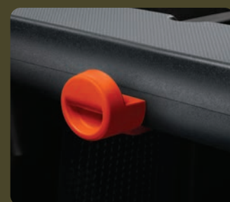
1 crochet à sac côté passager