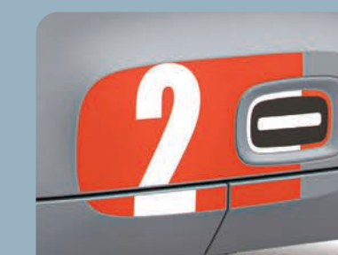
2 stickers de bas de porte oranges