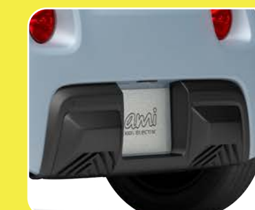
Renfort de pare-chocs arrière noir