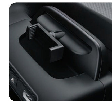
1 pince support pour smartphone