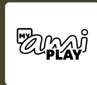
Application My Ami Play et bouton Citroën Switch