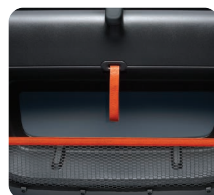
2 filets de porte noirs à bande horizontale