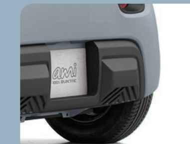
Renfort de pare-chocs arrière noir