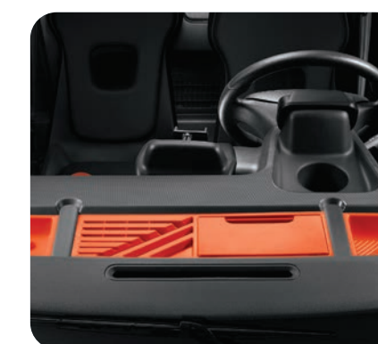
3 bacs de rangement de planche de bord