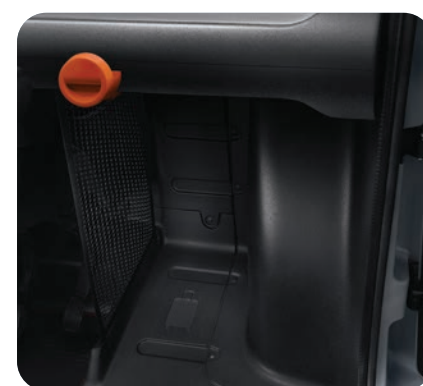
1 filet noir central de séparation