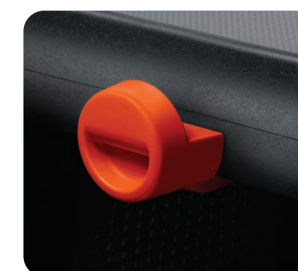
1 crochet à sac côté passager